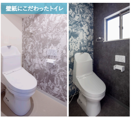
1階と2階を色違いのデザインに

旦那様 手間かもしれないけど、やっぱり何社か訪ねて比較することですかね。見積りをとったり色々話を聞いたり。リフォームは色々なところから情報を得て自分のものにする楽しさがありました。だから1社だけで決めないことですね。あとはセンスの良い営業かを見極めること。これは1番大事ですかね。 奥様 御社は女性のスタッフが多いという印象でした。なので、女性目線や若い方の感性ならではの新しい提案をしてくれそうという期待がありました。それでも自分で結構SNSは見ましたかね。モデルハウスも見に行きました。ネットでキッチン上のペンダントライトをよく見ていて、いいなと思っていただけ、実際に見たら何にもないダウンライトの方がスッキリしていいなって新しい発見がありました。実際のものを見ることは大事だなと改めて思いました。