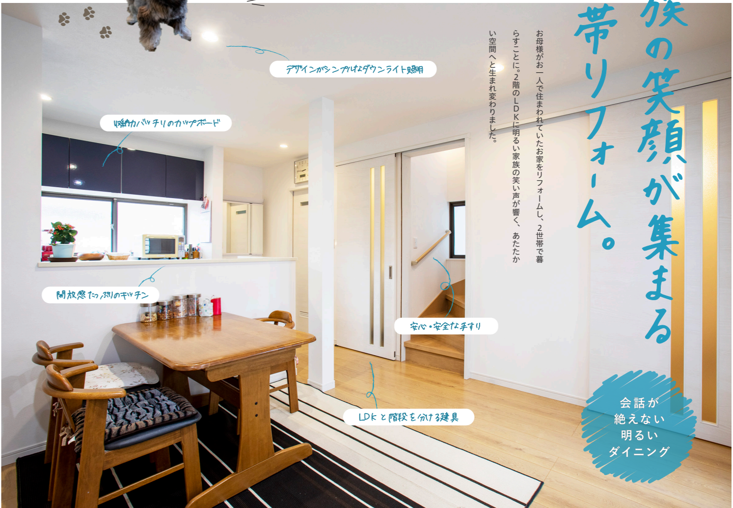
デザインがワンランクアップなダウンライト照明